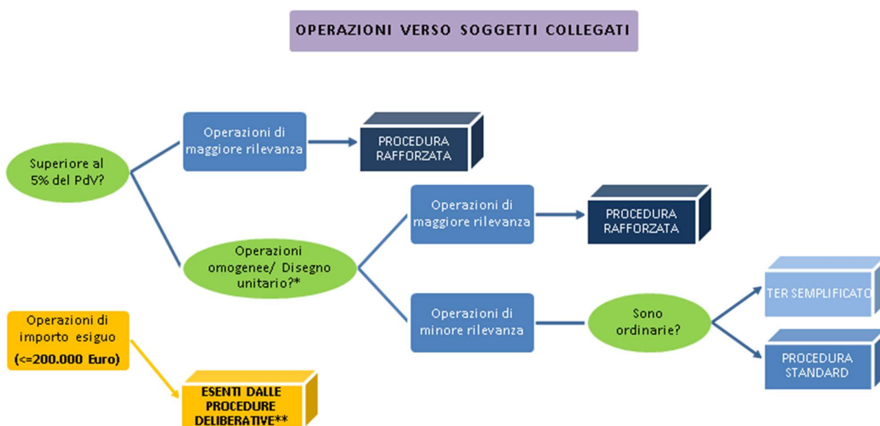
Figura 1: Schema per la classificazione delle operazioni con soggetti collegati.

Di seguito, si riporta uno schema che riassume sinteticamente il processo logico che conduce all'individuazione della tipologia di operazione con soggetti collegati e, di conseguenza, l'iter procedurale alla quale la stessa operazione è soggetta.