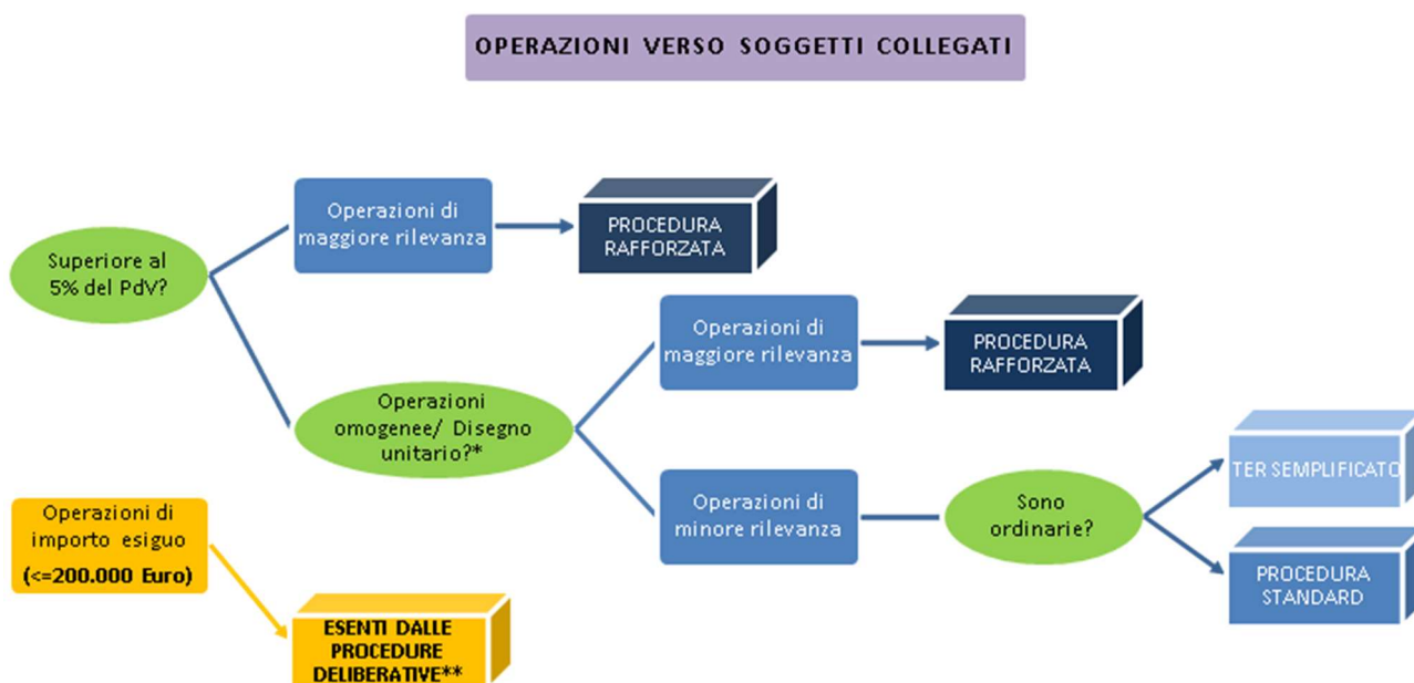
Figura 1: Schema per la classificazione delle operazioni con soggetti collegati.

Di seguito, si riporta uno schema che riassume sinteticamente il processo logico che conduce all'individuazione della tipologia di operazione con soggetti collegati e, di conseguenza, l'iter procedurale alla quale la stessa operazione è soggetta.